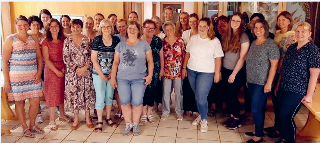
Die Teilnehmerinnen am Kochkurs