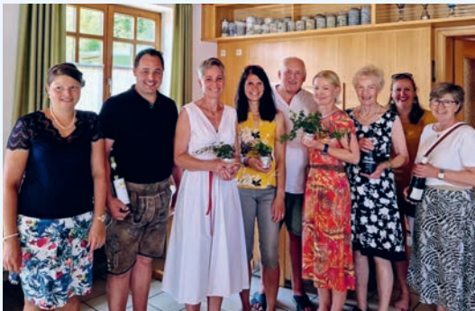
Die Pfarreirätselgewinner mit den Preisen.