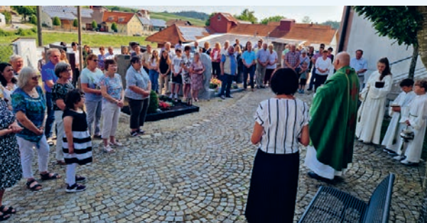
...mit großer Teilnahme der Ortsgemeinschaft von UE.