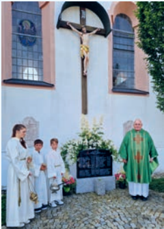
Bei der Segnung des Kreuzes...