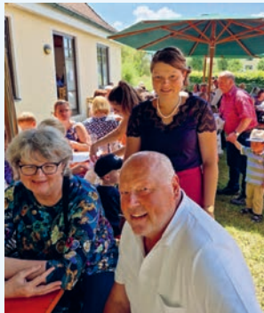
Sichtlich erfreut waren die PGR-Mitglieder über das gelungene Fest.